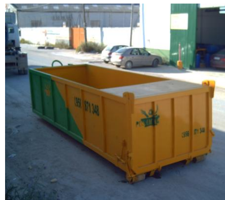
Contenedor con tapadera de 20 m 3