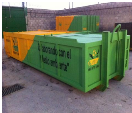
Contenedor con tapadera de 16 m 3