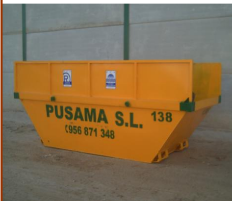
Contenedor de cadena de 9m 3