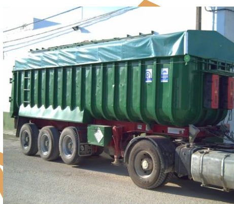
Bañera abierta de 22 m 3