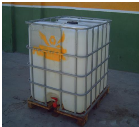
Gran Recipiente a Granel