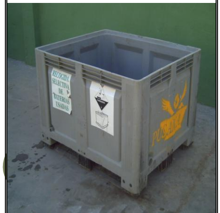
Caja estanca de plástico